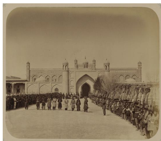
Qo'qon. Xon saroyining ichki darvozasi