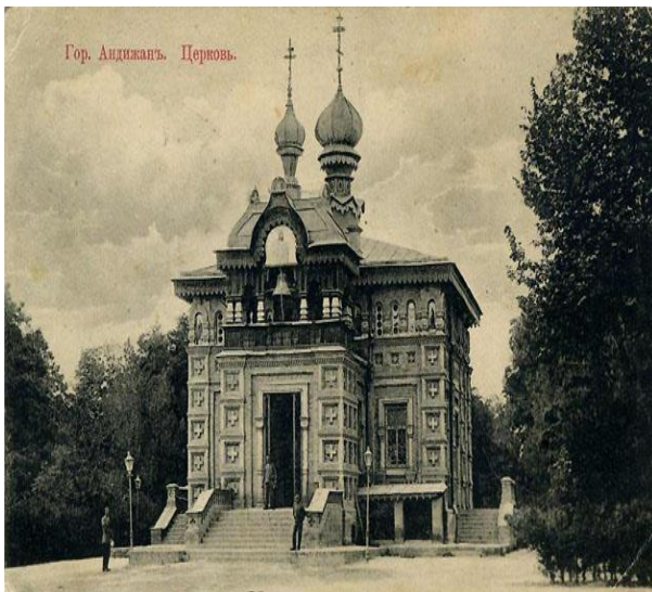
Andijon shahridagi cherkov