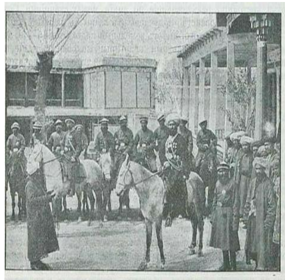
Qo'qon shahar mahalliy politsiyasi