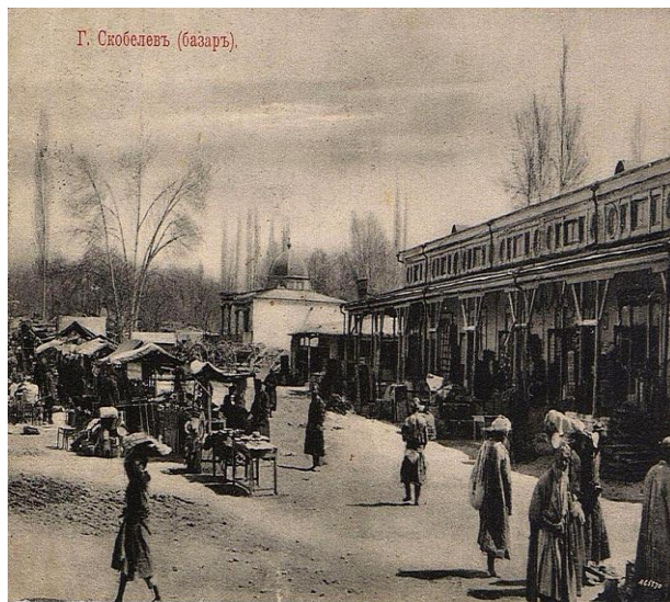
Skobelev (hozirgi Farg'ona) shahridagi bozor.