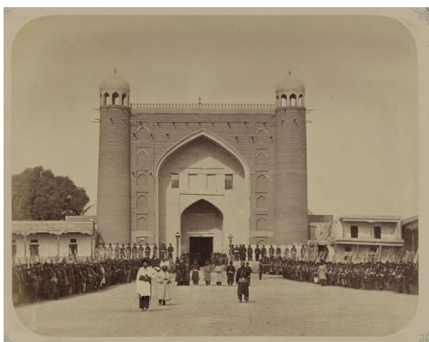
Qo'qon. Xon saroyining tashqi darvozasi