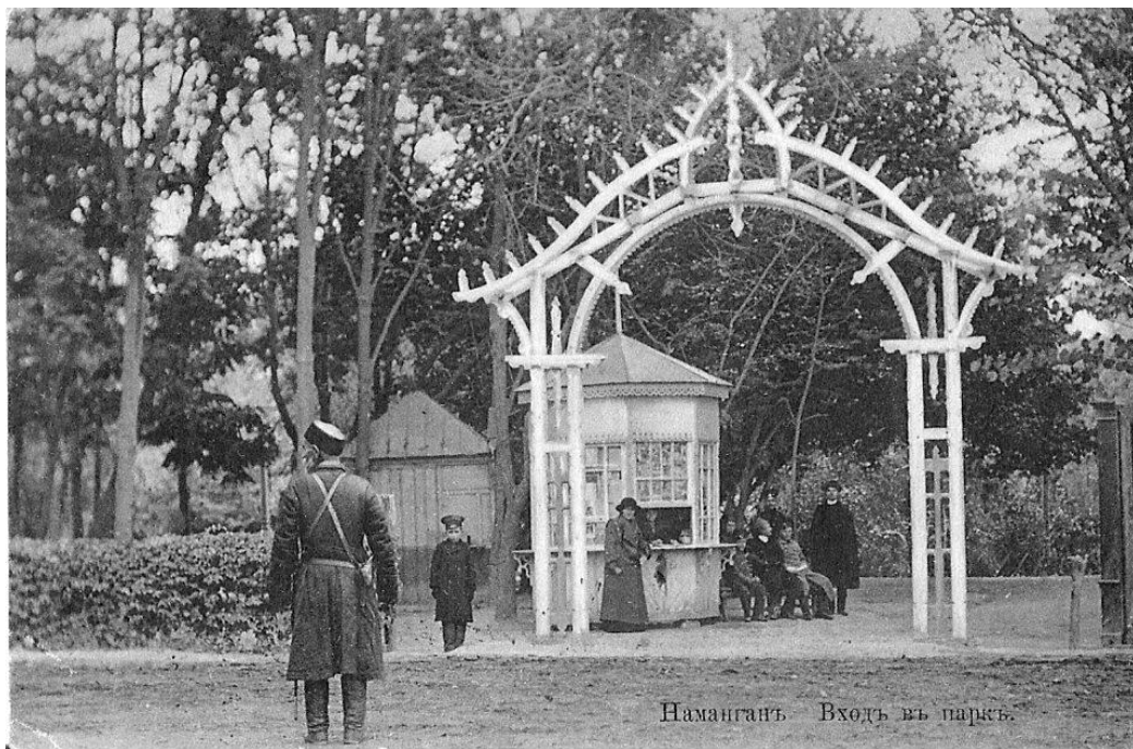
Namangan. Yangi shahar qismidagi bog'ning kirish qismi