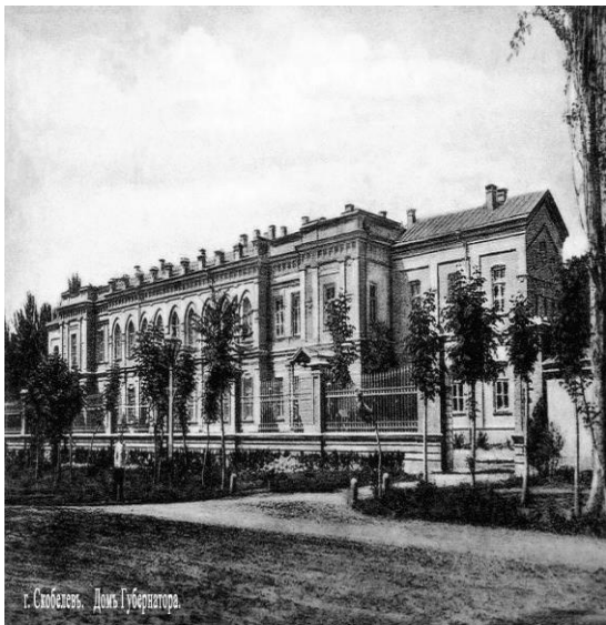
Yangi Marg'ilon, Skobelev. Gubernator uyi 1907-1914-yillar