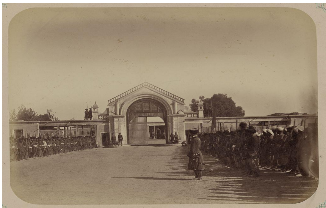
Andijon. Bek saroyi darvozasi