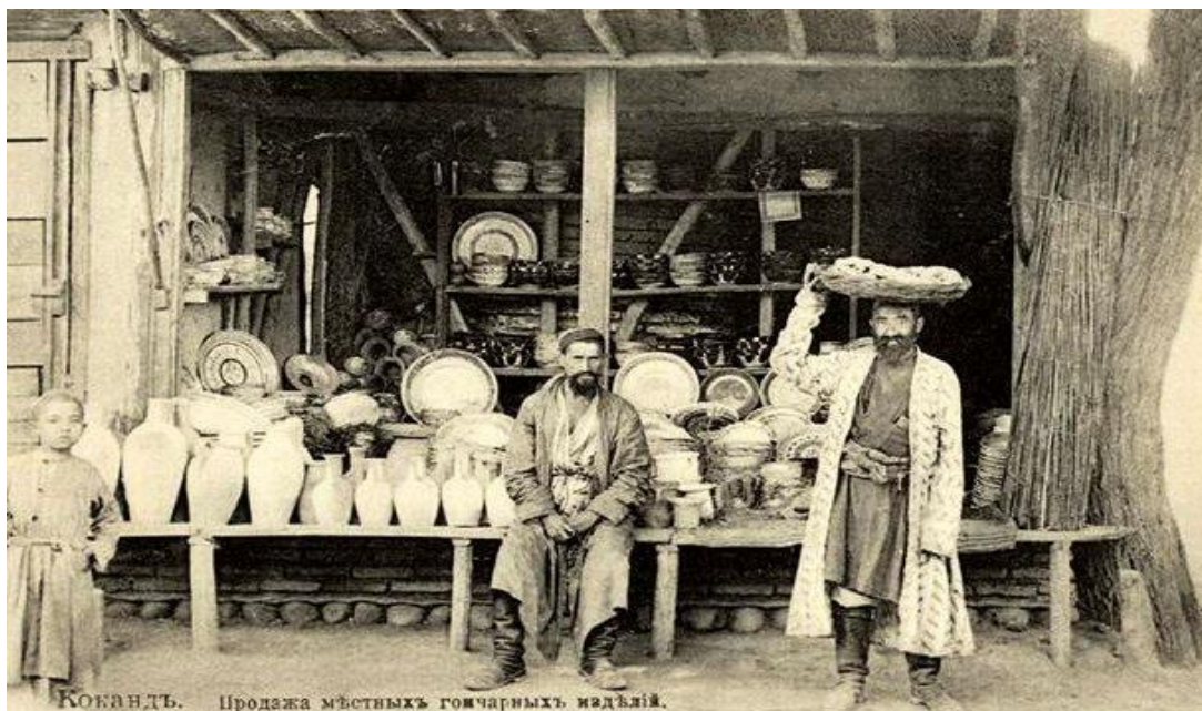
Qo'qon. Mahalliy kulolchilik mahsulotlari savdosi.