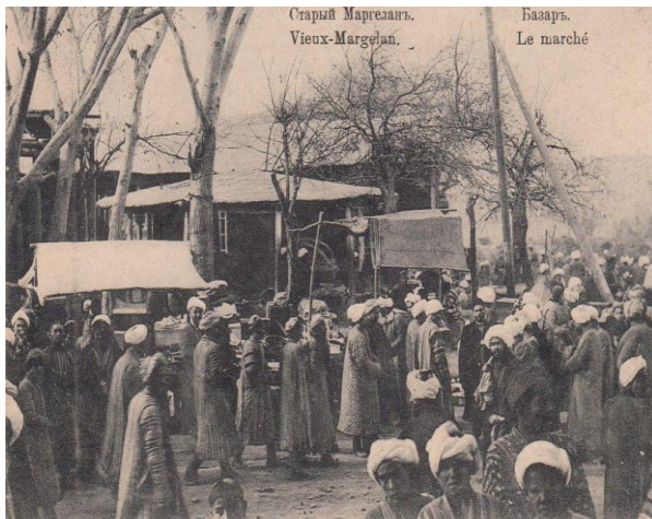
Eski Marg'ilon shahri. Bozor