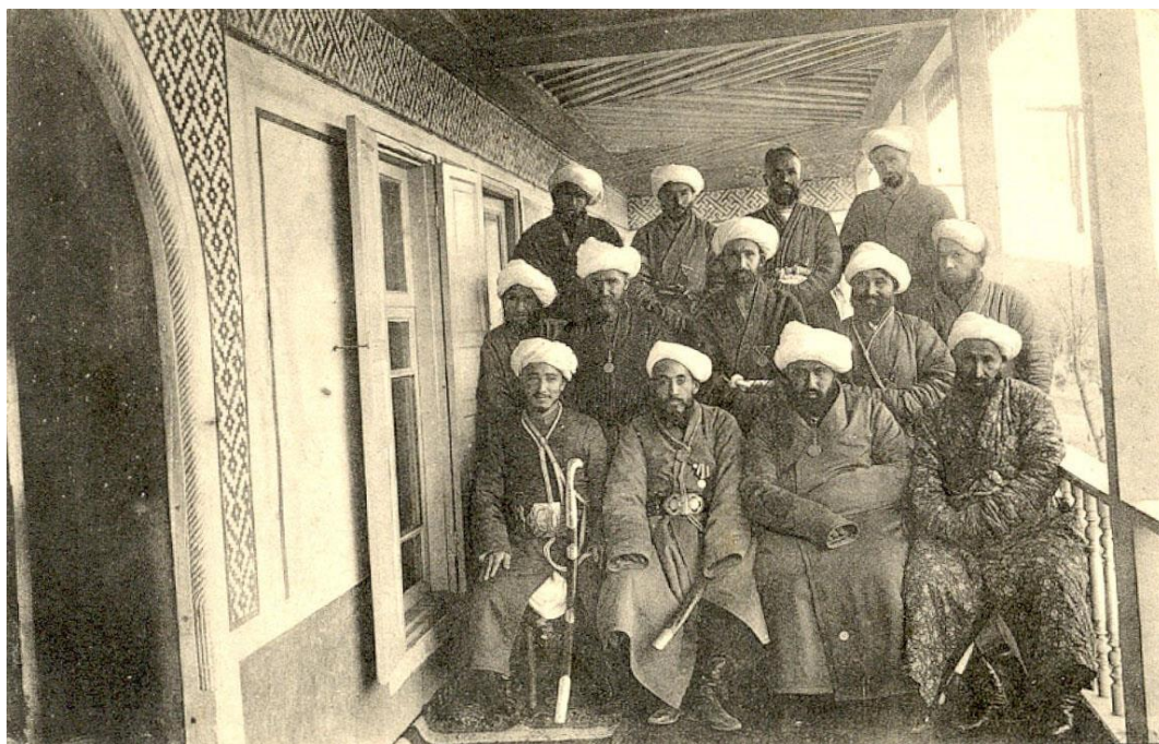
Farg'onadagi volost hokimlari va qishloq mirshablari guruhi