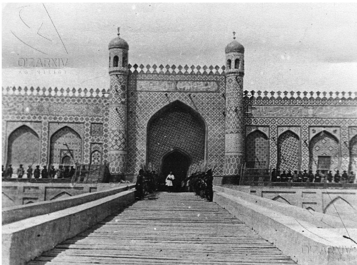
Qo'qon. Xudoyorxon saroyi