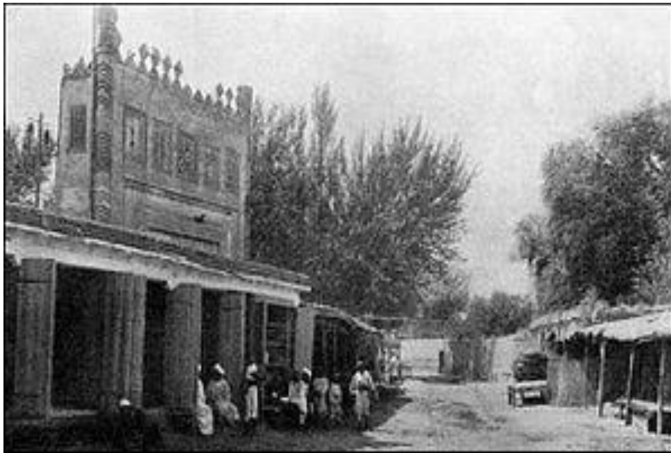
1913-yil Andijon ko'chasi ko'rinishi.