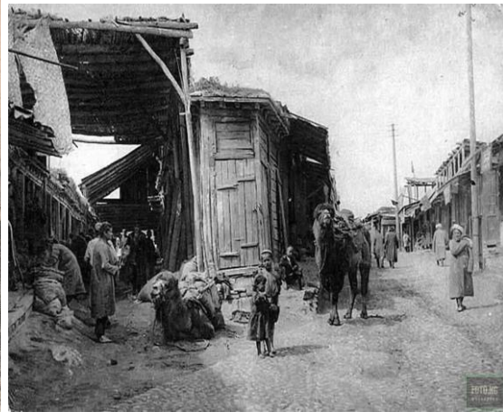
O'sh. Eski shahar qismi