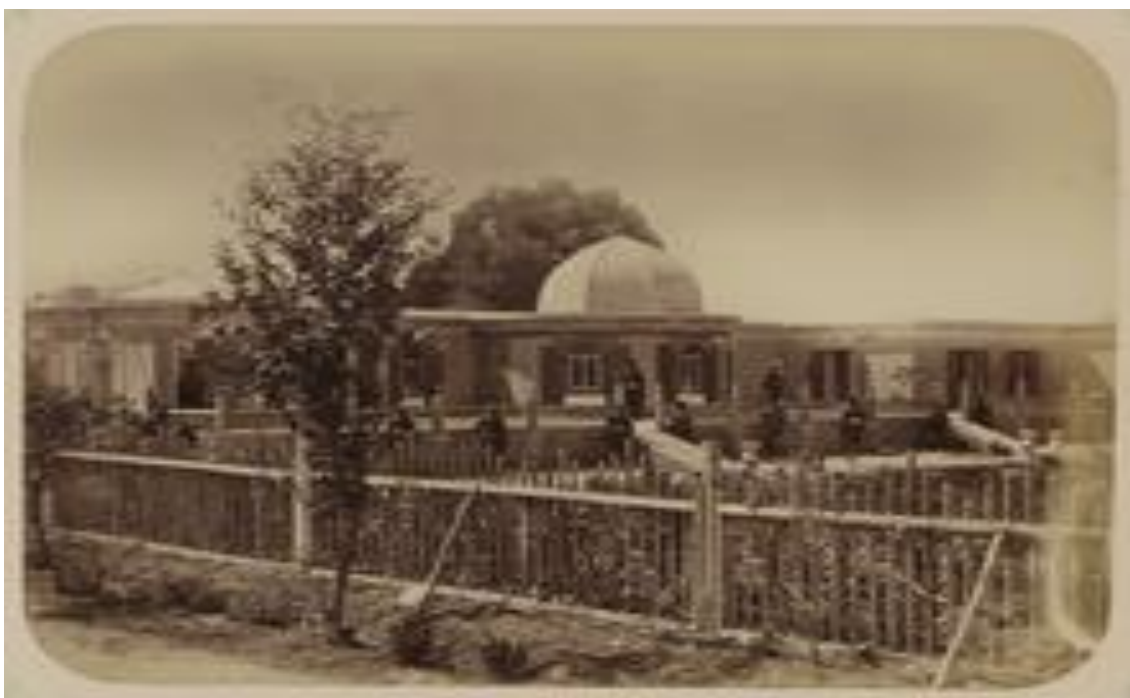
Andijon. Bek saroyi.