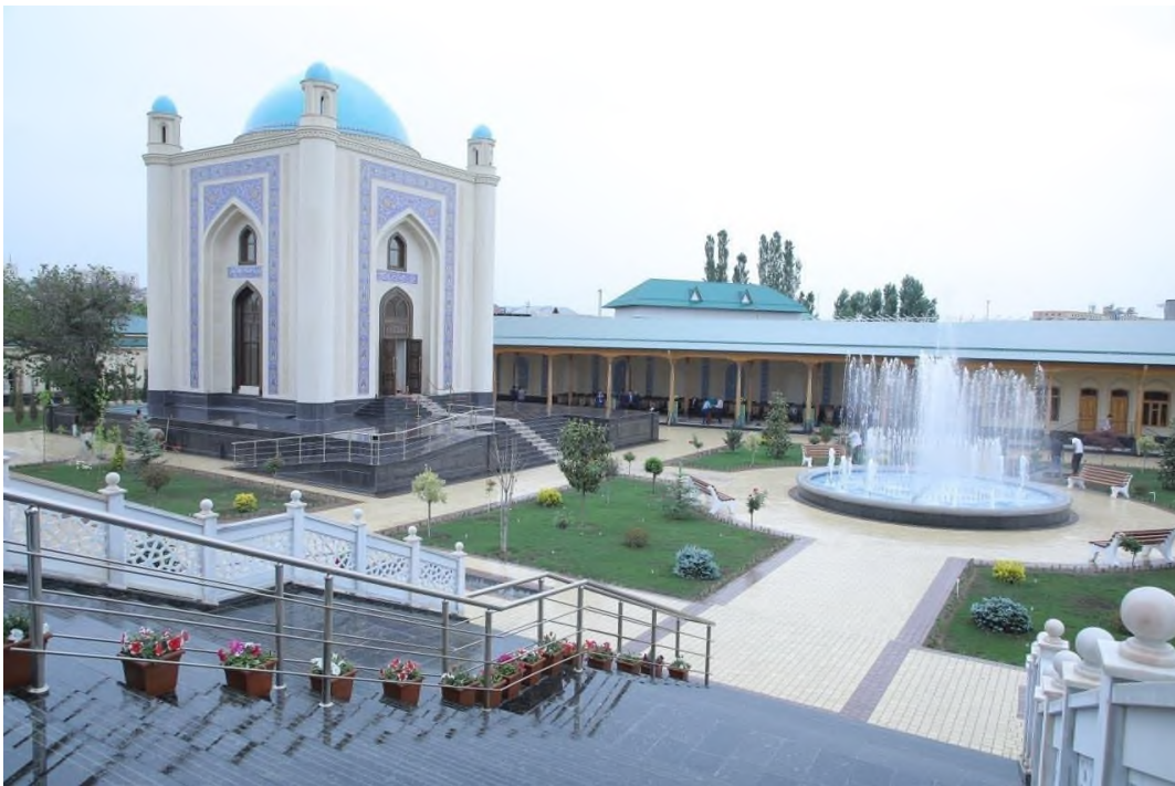
3-rasm. Namangan viloyati Namangan shahrida joylashgan “O‘n bir Ahmad” ziyoratgohi

Ziyoratgohni qurishda milliy me’morchilik an’analaridan foydalanilgan. “O‘n bir Ahmad” ziyoratgohi majmuasi atrofini istirohatgohga aylantirish maqsadida ko‘kalamzorlashtirish va obodonlashtirish ishlari amalga oshirilgan.