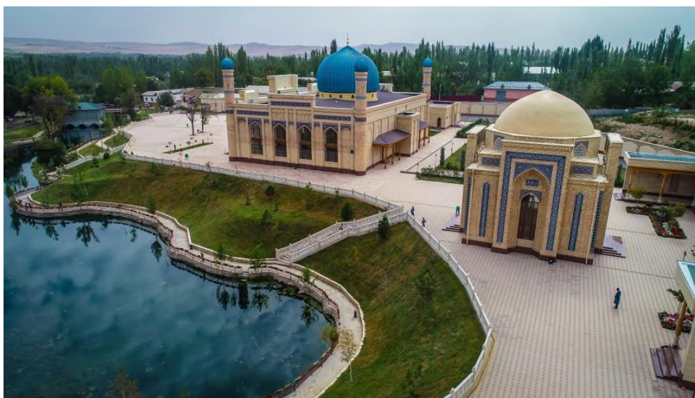
2-rasm. Namangan viloyatining Chortoq tumanida joylashgan Sulton Uvays Qaroniy majmuasi

So'nggi yillarda "Sulton Uvays Qaroniy" majmuasi hududida keng ko'lamli qayta qurish ishlari olib borildi. Majmua hududi va unga tutash qism obodonlashtirildi, kutubxona va hattoki mehmonxona qurildi. Bugungi kunda majmuada ziyorat marosimlarini amalga oshirish uchun barcha sharoitlar yaratilgan. Asosiy kirish ramziy darvoza bilan bezatilgan. Markaziy qismida suv ombori joylashgan, masjid va maqbaraning qad rostlagan binolari shu qadar mohirlik bilan bezatilganki, ular qushlar uchadigan balandlikdan qaraganda o'yinchoqlarga o'xshab ko'rinadi.