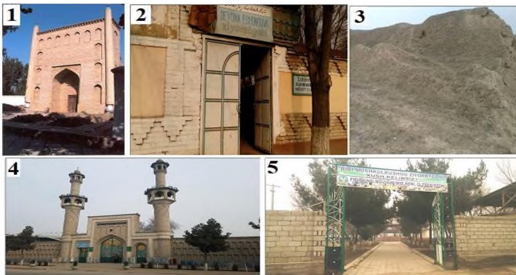
1-rasm. Namangan viloyatida joylashgan muqaddas ziyoratgohlar. 1. “Devona buva” maqbarasi, 2. “Devona Eshon buva” ziyoratgohi, 3. “Munchoqtepa” ziyoratgohi, 4. “Shayx Isoq Eshon” majmuasi, 5. “Mushkulkushod” ziyoratgohi